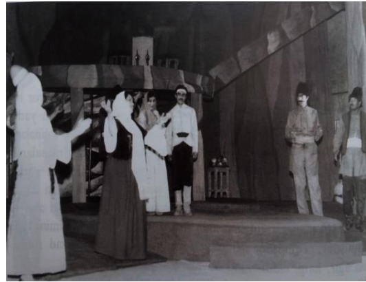
Şəkil.2."Əlincə qalası" tamaşasından səhnə

C.Məmmədquluzadənin bu əsərinə hazırlanan səhnə tərtibatında perspektiv xüsusiyyətlər daha çox diqqəti cəlb edir. Belə ki, uzaqda görünən qarlı dağlar, ikinci planda Naxçıvan qəbiristanlığı, ön planda isə Naxçıvanda qəbiristanlığın yaxınlığında yerləşən İmamzadə türbəsi təsvir olunmuşdur.(şək.1)