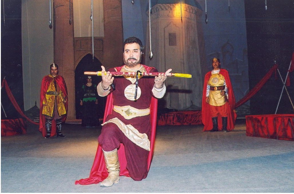
Şəkil.3."Atabəylər" tamaşasından səhnə