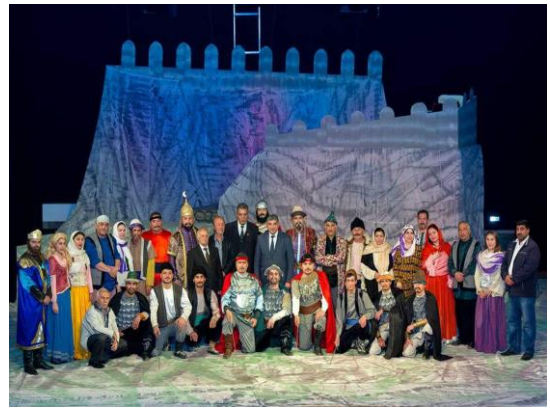
Şəkil.4-5. "Əlincə qalası" tamaşasından səhnə

Naxçıvan Muxtar Respublikası Ali Məclisin Sədri Vasif Talıbov tamaşadan sonra səhnə arxasında aktyorlara təşəkkür etmiş və demişdir: "...Əlincə qalası Naxçıvanın simvoludur. Böyük fəth Əmir Teymur Əlincə qalasında məğlubiyyətə uğrayaraq geri döndü. Gərək bizim düşmənlərimiz bunu gözəl anlayalar. Naxçıvan həmişə Əlincə qalasıdır-alınmaz qaladır. 1993-cü ildə Naxçıvanın ağır dövründə Naxçıvanın qəhrəman oğulları Ümummilli Liderimizin ətrafında birləşdilər və bu yenilməz qalanı qorudular. Bu gələcəkdə də belə olacaqdır. Naxçıvan heç vaxt əyilməyəcək, heç zaman Naxçıvan torpağı düşmən qarşısında baş əyməyəcək, özünü gücsüz göstərməyəcəkdir".(5)