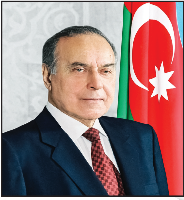
Naxçıvan Dövlət Universiteti Azərbaycanın ən dəyərli, qabaqcıl ali məktəblərindən biridir